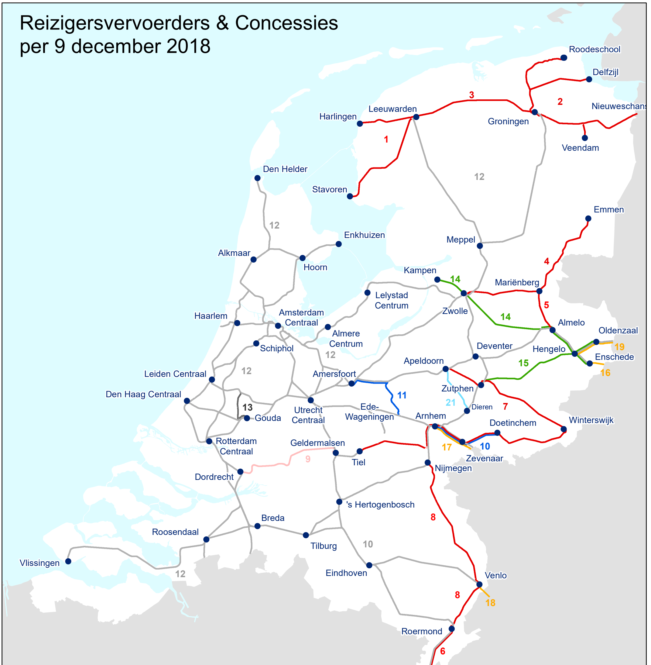
Overzicht Concessies per Vervoerder per 9 december 2018